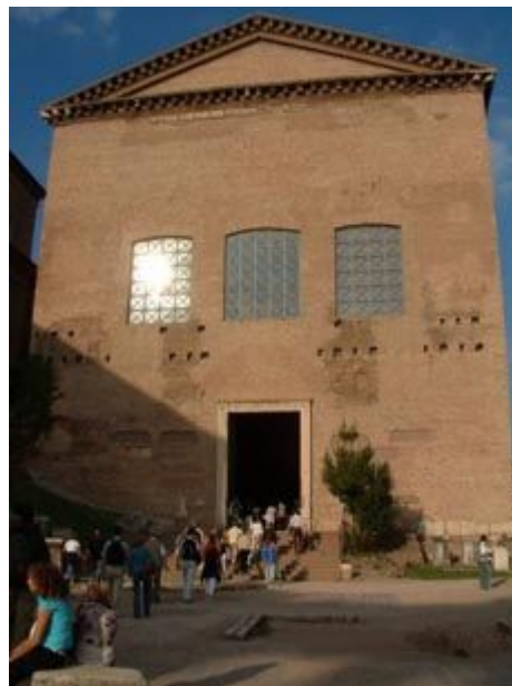
Illustration 1: Kuria na Forum Romanum. To w tym budynku obradował senat.

Wyjątkowym urzędem, który powołano zaraz po wprowadzeniu konsulów był dyktator (dictator). Urząd ten utworzono głównie ze względu na bardzo ciężką sytuację polityczną tego okresu, kiedy w państwie istniał istny chaos wewnętrzny. Dyktator był mianowany przez konsula na okres sześciu miesięcy i wyposażony w nieograniczoną