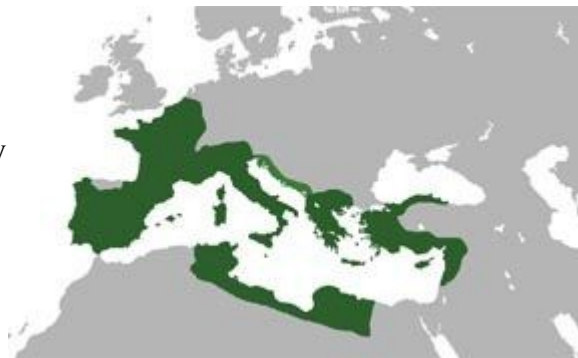
Illustration 2: Terytorium republiki rzymskiej w 44 roku p.n.e.

Opanowanie jednak całego półwyspu Apenińskiego nie wystarczyło Rzymowi. Zaczęto prowadzić ekspansję poza obręb Italii: na Sycylii,