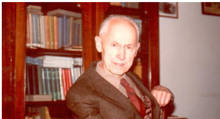
W Warszawie, rok 1979.

Myśląc jak im odpowiedzieć, zastanowiłem się co było najbardziej charakterystyczne dla kontaktów z nim i doszedłem do wniosku, że gdybym był zmuszony ograniczyć się do jednego słowa, to najbliższe moim odczuciom było: naturalność .